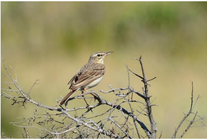
En haut : Aigle de Bonelli ( Aquila fasciata ). En bas : Alouette lulu ( Anthus campestris )

Enfin, des suivis annuels sont menés par le SMGG, en partenariat avec la Fédération départementale des Chasseurs du Gard, pour le Lapin de garenne et la Perdrix rouge. En effet, ces deux espèces sont toutes deux menacées et à fort enjeux car respectivement une espèce clé de voûte (dont l'effet est majeur par rapport à son abondance) et une espèce parapluie (dont la protection permet celle de nombreuses autres espèces). D'autre part, leur conservation bénéficie directement à celle de l'Aigle de Bonelli puisqu'elles font partie du régime alimentaire de ce rapace protégé.