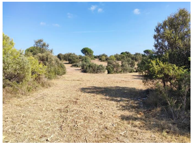
En haut : avant intervention. En bas : après intervention